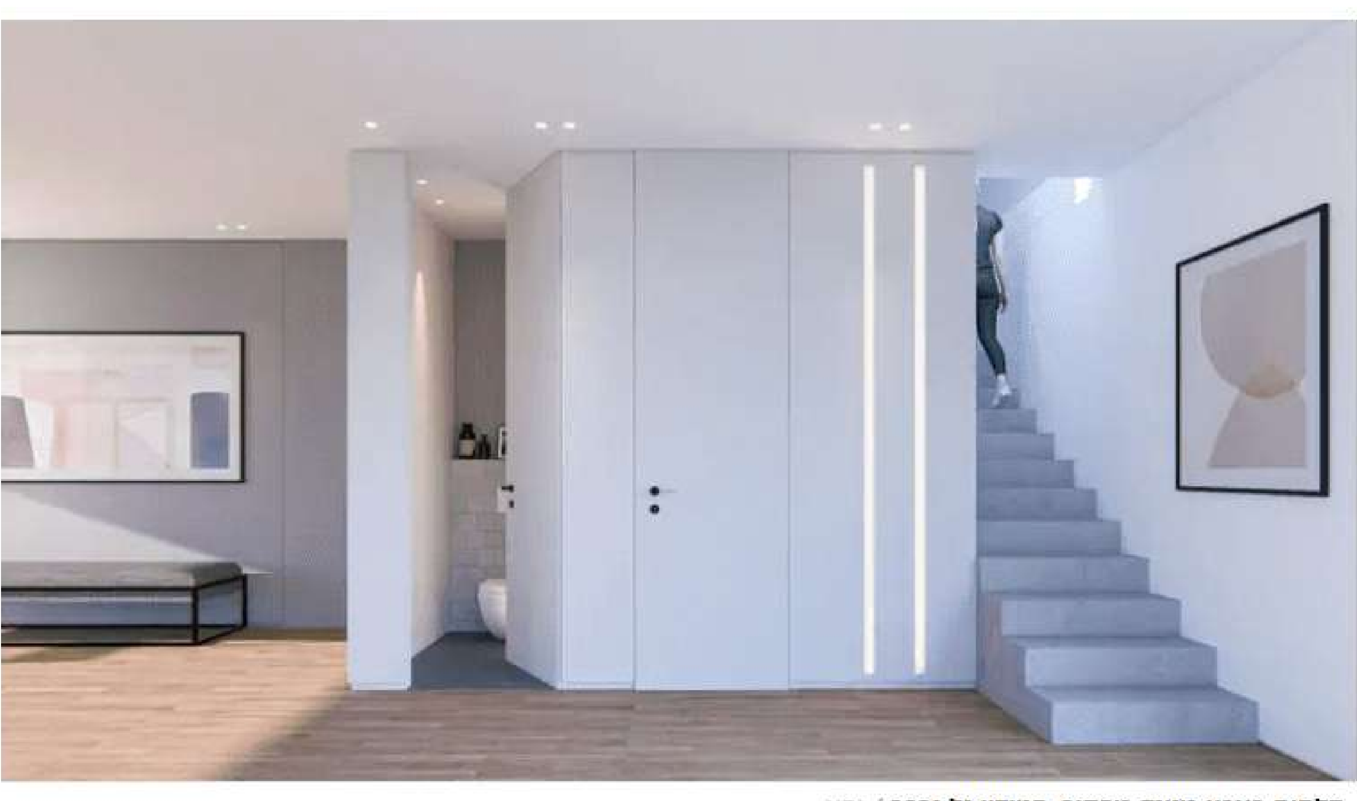
דלתות בצבע מנוגד מהקיר. סטודיו גל גרבר / יחצ

במיוחד בדירות סטודיו, בהן לרוב אין הפרדה ברורה בין האזורים השונים, מומלץ ליצור חלוקת חלל מתוכנמת שעדיין תאפשר זרימה ולא תכביד על המרחב. פריטי ריהוט כמו ספה המוצבת כקו מפריד, מדפים או מחיצות קלות יכולים להוות גבול בין אזור השינה לאזור המגורים או העבודה. חלוקה נכונה מאפשרת לדיירים להרגיש שהם מתנהלים בין אזורים נפרדים גם במרחב קטן.