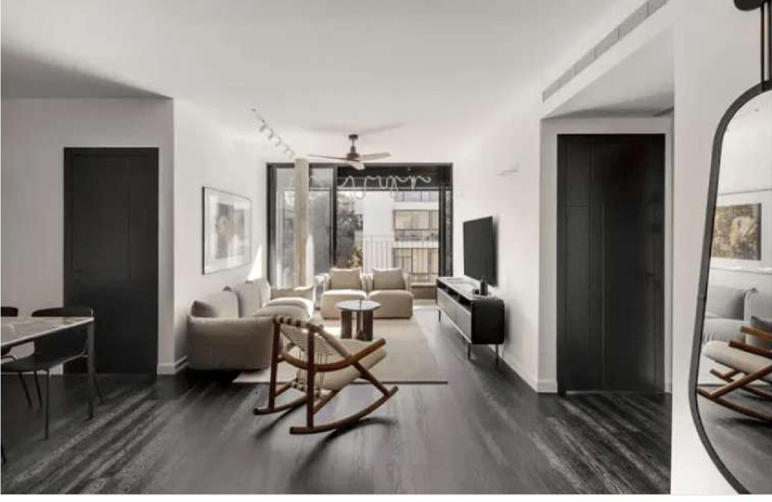
דלתות FREAMS של המעצבות / עודד סמדר

עיצוב דירות קטנות, כמו דירות סטודיו ודירות שני חדרים, הוא מאתגר. כאשר המרחב מוגבל, כל פרט בעיצוב יכול לשנות את האווירה והתחושה הכללית של הבית. תחושת מרחב ונוחות, תוך שמירה על פרקטיות ומקומות אחסון - יעשו את העבודה