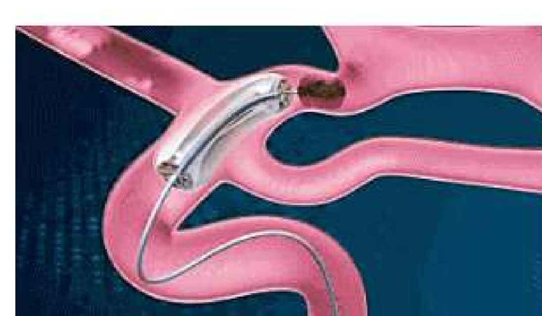
סטארטאפ ישראלי מהפכני בעולם